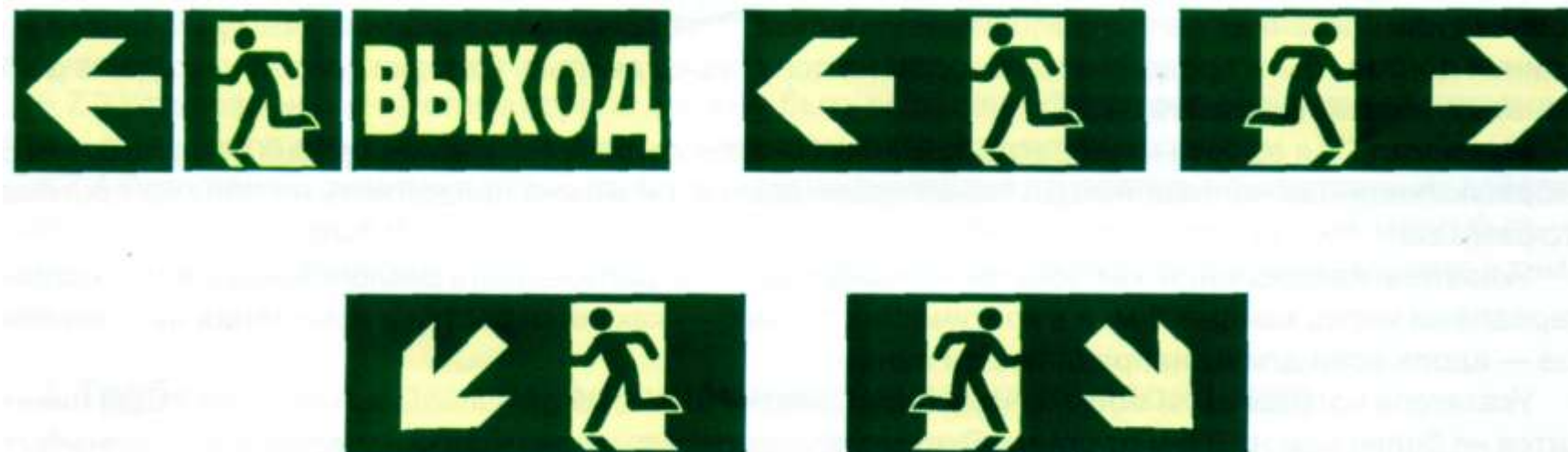
"Рисунок 2 - Примеры знаков маршрутов эвакуации или указателей направления, которые допускается использовать вместе с текстом"

6.5.2 Направление, указываемое стрелкой, используют исключительно для обозначения направления движения при эвакуации. Знаки маршрута эвакуации, указывающие направление движения (см. рисунки 2 и 3 ), следует применять исключительно для обозначения направлений, по которым должны следовать люди. Графический символ в знаке направления на верхнем, среднем и нижнем уровнях следует всегда использовать в сочетании с соответствующей стрелкой.